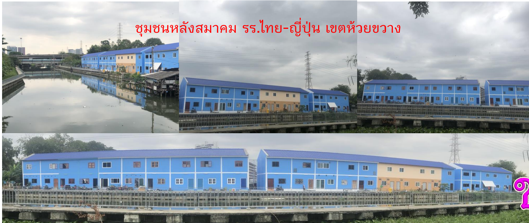
ชุมชนหลังสมาคม รร.ไทย-ญี่ปุ่น เขตห้วยขวาง