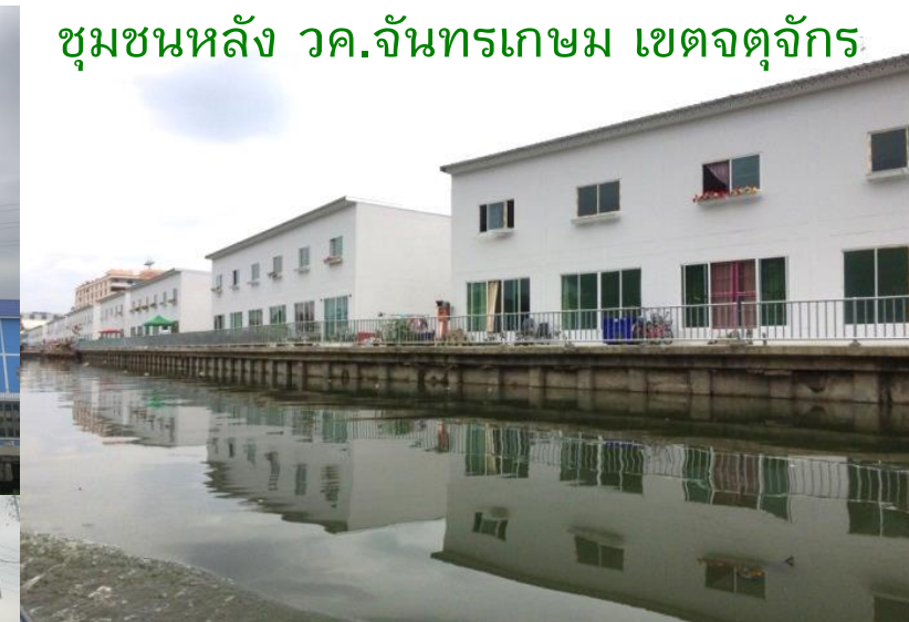
ชุมชนหลัง วค.จันทรเกษม เขตจตุจักร