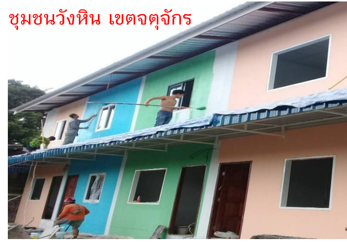
ชุมชนวังหิน เขตจตุจักร