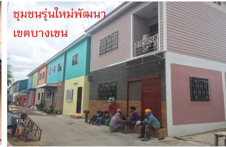
ชุมชนรุ่นใหม่พัฒนา เขตบางเขน