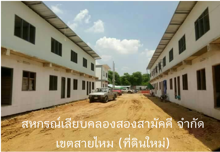
สหกรณ์เลียบคลองสองสามัคคี จำกัด เขตสายไหม (ที่ดินใหม่)

ก่อสร้างบ้านแล้วเสร็จ และอยู่ระหว่าง ดำเนินการก่อสร้าง 3,005 ครัวเรือน ร้อยละ 42.51 จาก เป้าหมาย 7,069 ครัวเรือนใน 50 ชุมชน